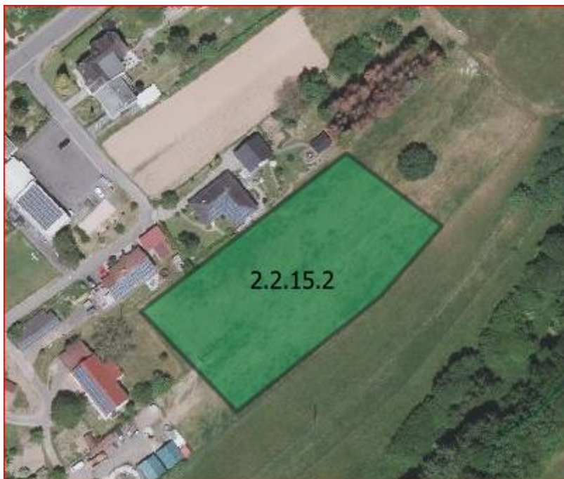
Abbildung 2: Biotoptypenstruktur des Aufhebungsbereichs Lindscheid (oben) und Lindscheid (unten)