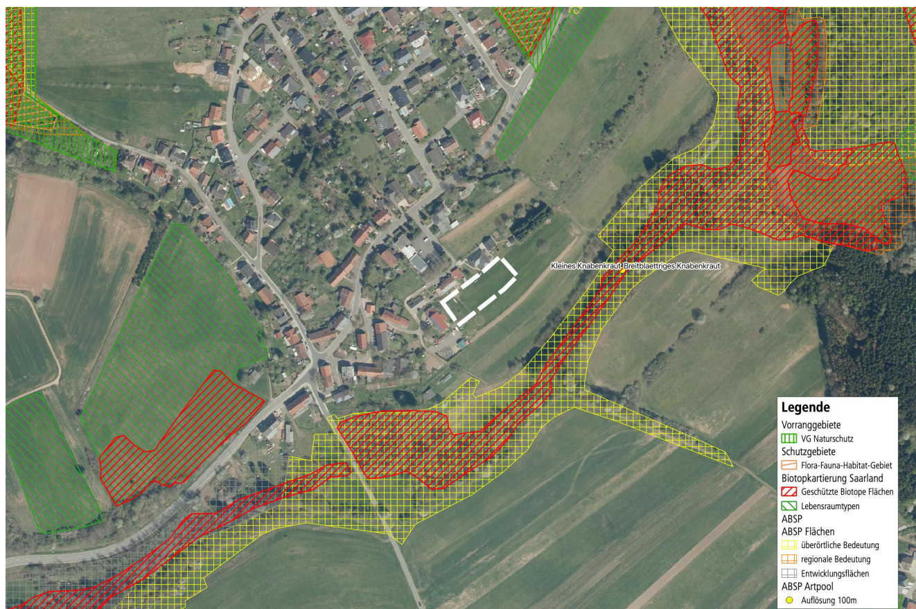
Plangebiet und Restriktionen, Stand 30.06.2023