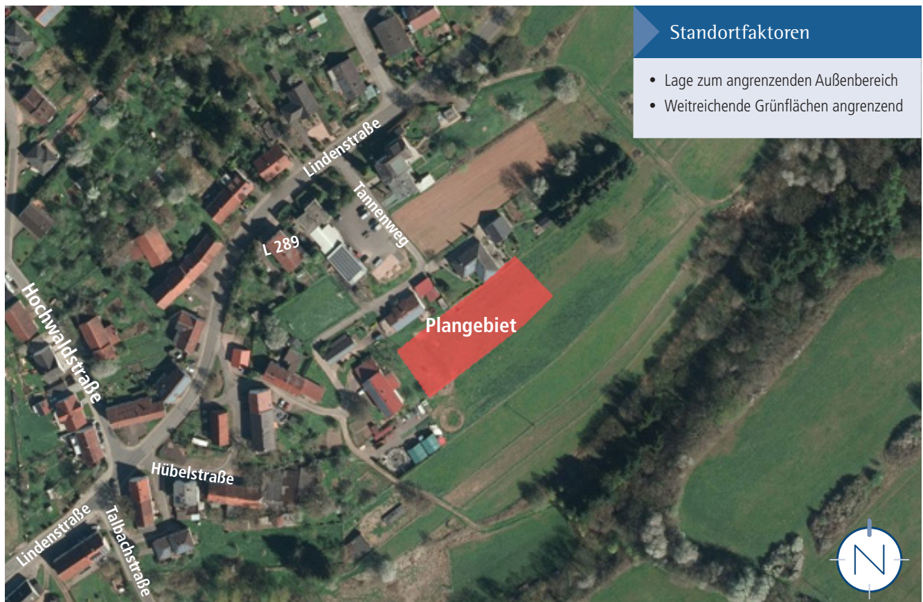
Lage im Raum; Quelle: LVGL Saarland; Bearbeitung: Kernplan

Parallel zur Teiländerung des Flächennutzungsplanes ist eine Umweltprüfung nach § 2 Abs. 4 BauGB durchzuführen. Der Umweltbericht ist gesonderter Bestandteil der Begründung.