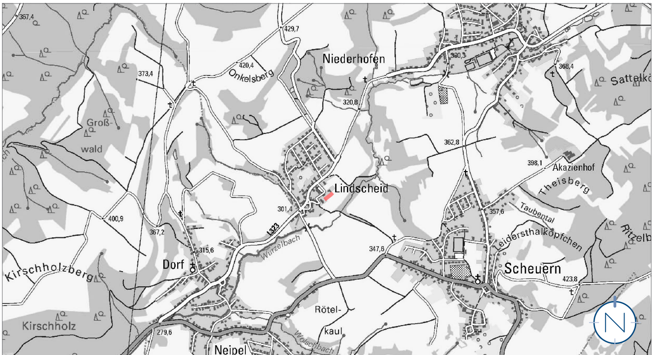
Übersichtsplan mit Geltungsbereich; ohne Maßstab